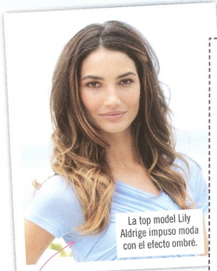
La top model Lily Aldridge impuso moda con el efecto ombré.