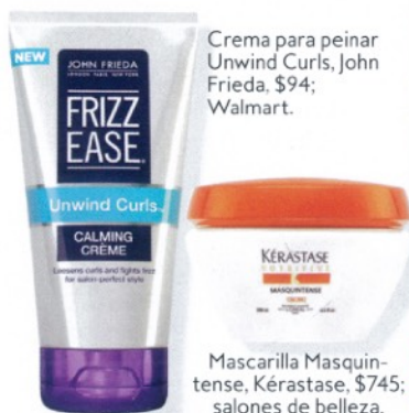
Crema para peinar Unwind Curls, John Frieda, $94; Walmart.

PRO TIP “Sé constante. Hidrata el pelo con una mascarilla dos veces por semana y aplica un protector si usas una herramienta de calor. Cuando utilices secadora, fíjate que el aire sea frío y úsala en sentido de la raíz a las puntas para cerrar la cutícula y no crear frizz”, finaliza el estilista.