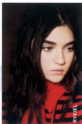
Mascarilla Masquintense, Kérastase, $745; salones de belleza.