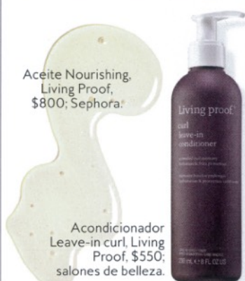
Aceite Nourishing, Living Proof, $800; Sephora.

PRO TIP “Debes tener cuidado de no tocarte el pelo todo el día. Combina tu acondicionador con algún aceite que no deje tus rizos tiesos como con efecto wet”, comenta. Para mejores resultados, aplica los productos cuando el pelo esté mojado.