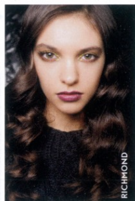
Acondicionador Leave-in curl, Living Proof, $550; salones de belleza.