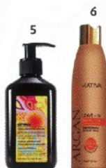
Los Leave-in conditioners serán tus mejores aliados.