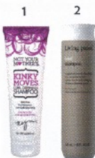
Estos shampoos nutren el pelo, ayudan a evitar el frizz y definen los rizos.

"La fórmula perfecta es: Trátalo en el día, lávalo con un shampoo de nutrición y finalmente utiliza un leave in conditioner para evitar frizz o enredos".