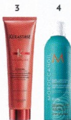
Acondicionadores que aportan control y forma, desorestan y suavizan el pelo.