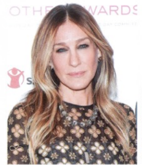
SARAH JESSICA PARKER